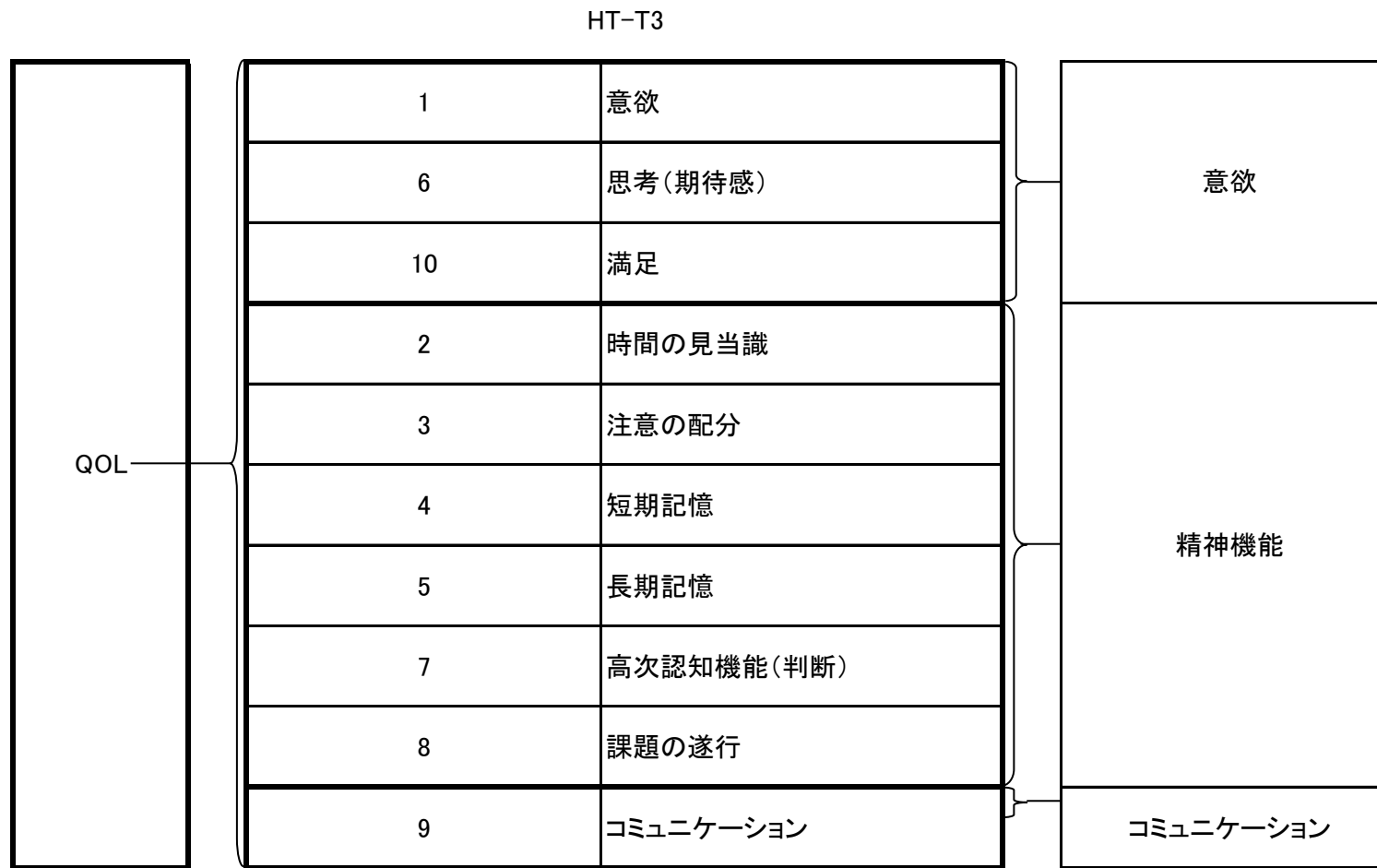
図4-1. HT-T3の項目と評価内容の関連.